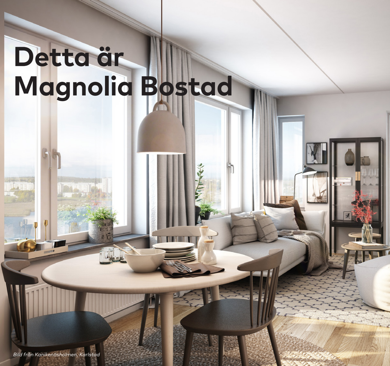
Bild från Kanikenösholmen, Karlstad

Magnolia Bostad utvecklar nya boenden, såväl hyresrätter som bostadsrätter, vårdboenden, hotell och studentboenden i attraktiva lägen i Sveriges tillväxtorter och regionstäder.