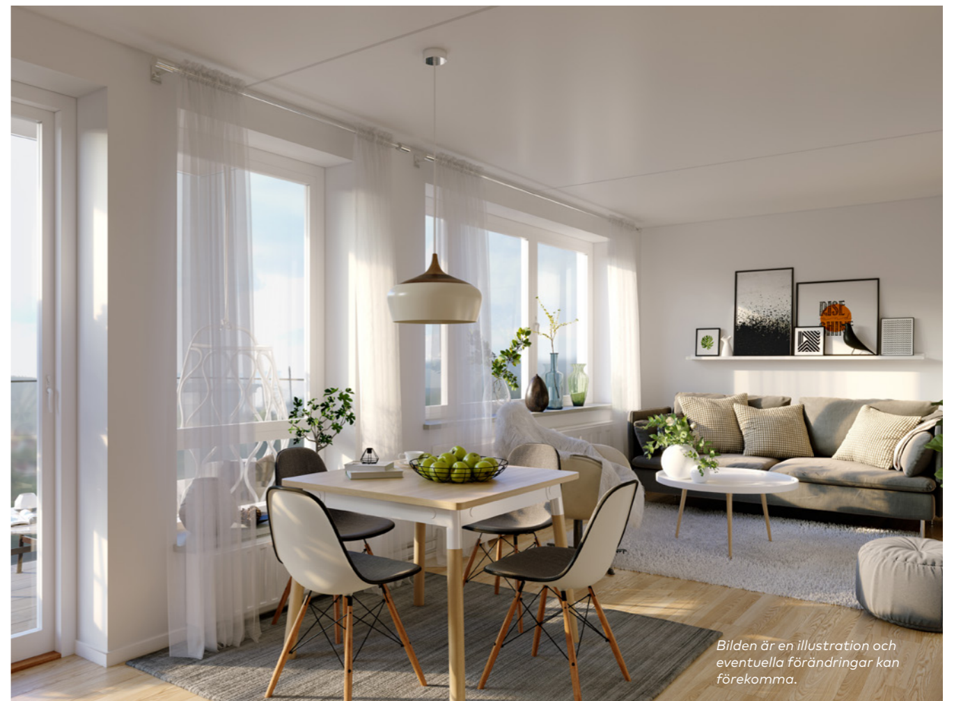
Bilden är en illustration och eventuella förändringar kan förekomma.