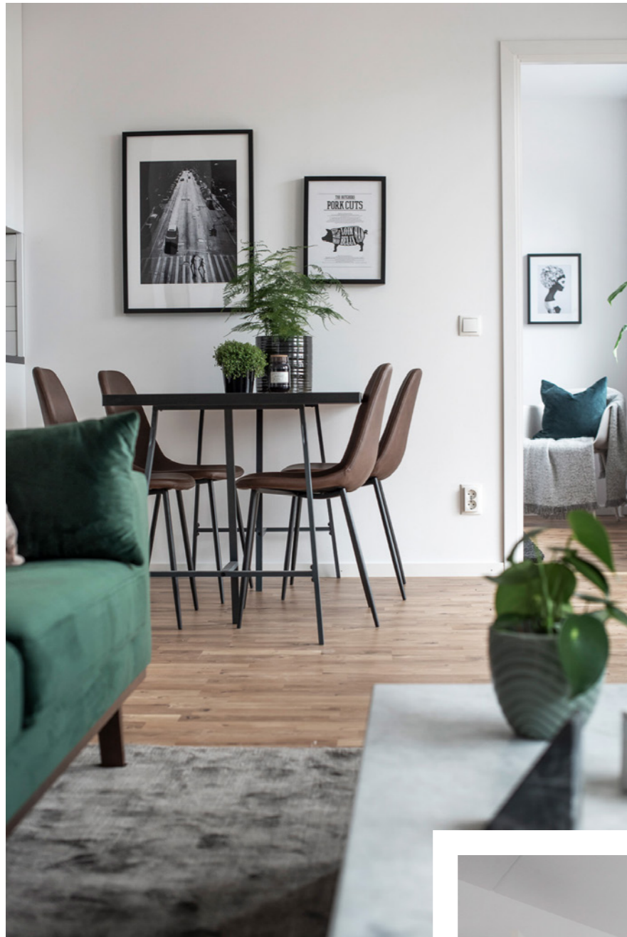
Lägenheterna har smarta planlösningar som erbjuder generöst ljusinsläpp. Den öppna planlösningen mellan vardagsrummet och köket bjuder in till social samvaro.