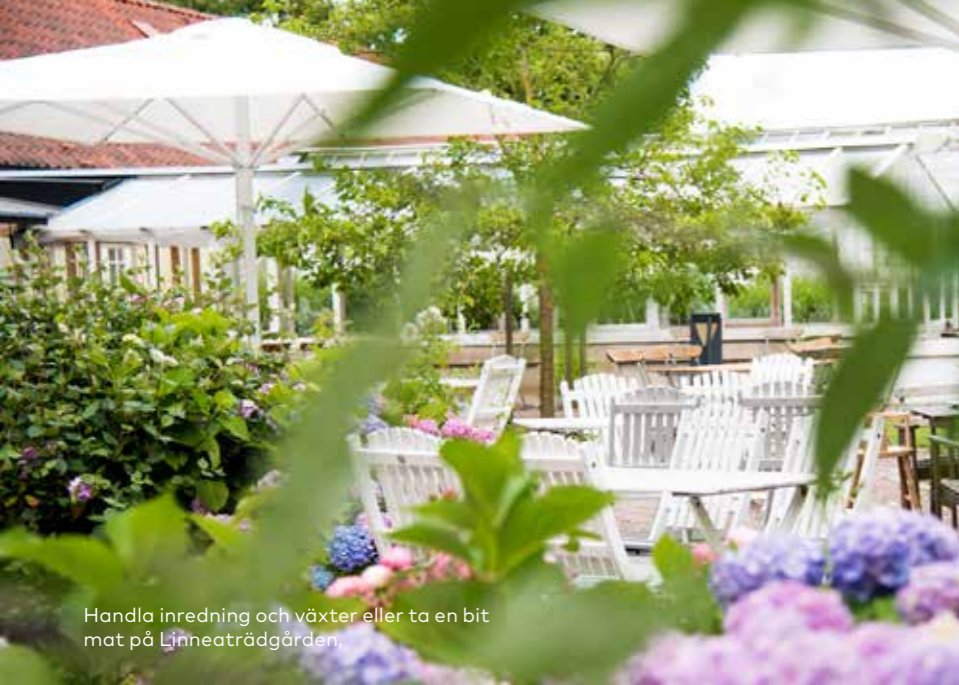
Handla inredning och växter eller ta en bit mat på Linneaträdgården.