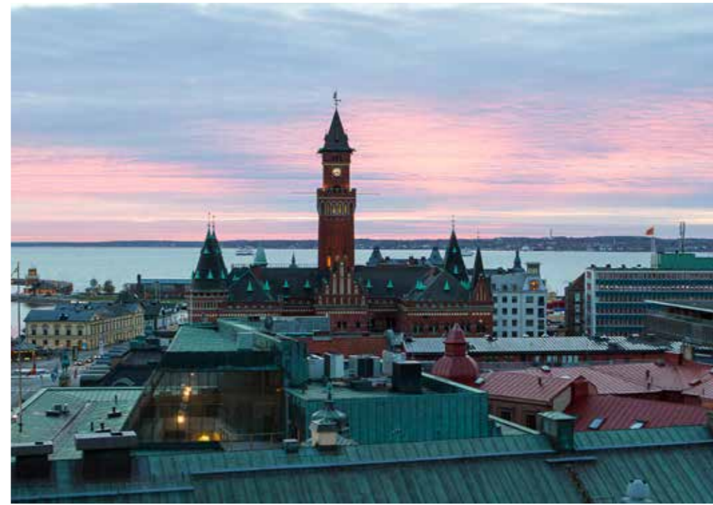
Som boende i Maria Mosaik har du cykelavstånd till havet och centrum.