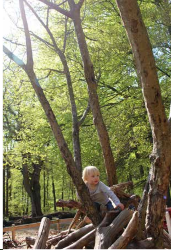
Gör en utflykt till Pålsjöskogen och avsluta med en våffla på Pålsjöpaviljongen.